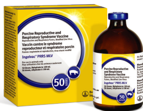
Ingelvac® PRRS MLV

Vaccinez contre le SRRP avec les produits suivants: