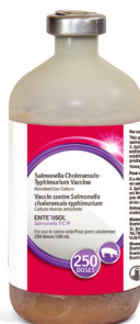
Enterisol Salmonella T/C®

Vaccinez contre Salmonella Typhimurium et Salmonella Choleraesuis avec le produit suivant: