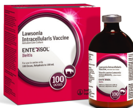
Enterisol MC Ileitis

Vaccinez contre Lawsonia intracellularis (iléite) avec le produit suivant: